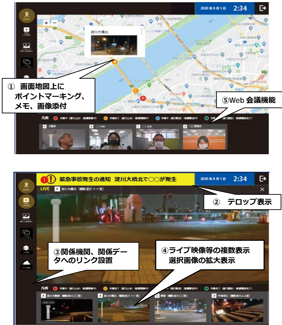
図-4 JACIC クラウド防災時画面のイメージ